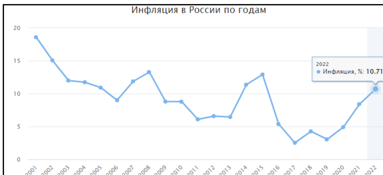
Рисунок 3 – Уровень инфляции с 2001 по 2022 год

13 мая 2017 года Президентом РФ был подписан Указ «О стратегии экономической безопасности Российской Федерации на период до 2030 года» № 208. Данный документ направлен на обеспечение противодействия вызовам и угрозам экономической безопасности, предотвращение кризисных явлений в ресурсно-сырьевой, производственной, научно-технической и финансовых сферах, а также недопущение снижения качества жизни населения [Указ, 2017]. Все вышеперечисленное является основным приоритетом государственной политики в области экономической безопасности на сегодняшний момент.