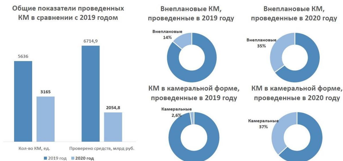
Рисунок 1 – Информация о количестве и видах контрольных мероприятий, проведенных в 2020 году

Информация о количестве и видах контрольных мероприятий, проведенных в 2020 году, представлена на рисунке 1.