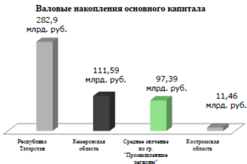
Рис. 2 - Валовые накопления основного капитала, (млрд. руб.). Положение Кемеровской области в рейтинге группы «Промышленные регионы». Республика Татарстан - 1 место, Кемеровская область – 13 место, Костромская область - 36 место.

В своей группе «Промышленные регионы» (см. рис. 2) по данному показателю Кемеровская область занимает 13 место из 36. В 2012 году валовой региональный продукт (ВРП) региона составил 512,41 млрд. руб. Валовые накопления основного капитала (Чистые накопления) составили 111,59 млрд. руб. Индекс чистых накоплений (ИЧН) является отношением: ИЧН = ВП / ВРП * 100\% , и составляет 21,78%. Самые высокие валовые накопления в группе «Промышленные регионы» имеет Республика Татарстан, ВРП которой составляет 885,06 млрд. руб., ВН 282,90 млрд. руб., а ИЧН 31,96%. Основными ее отраслями являются нефтедобыча, химия и нефтехимия и машиностроение. На последнем 36 месте в группе регионов находится Костромская область, ВРП которой составляет 78,92 млрд. руб., ВН 11,46 млрд. руб., а ИЧН 14,52%. Основными видами ее промышленного производства являются: производство электрической и тепловой энергии, производство ювелирных изделий и обработка древесины и производство изделий из дерева (см. Приложение №2).