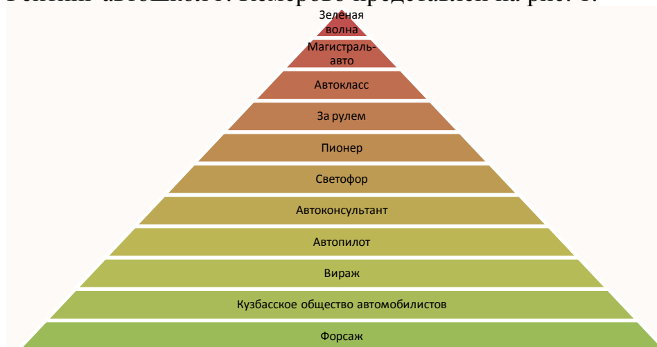
Рисунок 1– Рейтинг автошкол г. Кемерово.

Рейтинг автошкол г. Кемерово представлен на рис. 1.