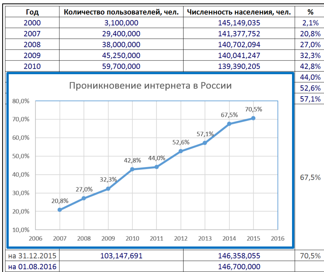
Рисунок 2 - Динамика прироста интернет-аудитории в России

Российская интернет-аудитория прирастает жителями регионов, относительно небольших населенных пунктов, представителями старших возрастных групп. По данным агентства анализа Интернет пользователей (Internet World Stats) и исследовательской компании «GfK» (рисунок 2) проведен анализ прироста аудитории интернета [2, 5].