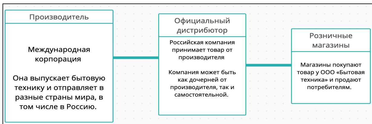
Рисунок 1 – Механизм работы при непараллельном импорте

Разберемся с понятийным аппаратом нашего исследования и проанализируем механизмы работы непараллельного и параллельного импорта, представленные на рисунках 1 и 2 соответственно.