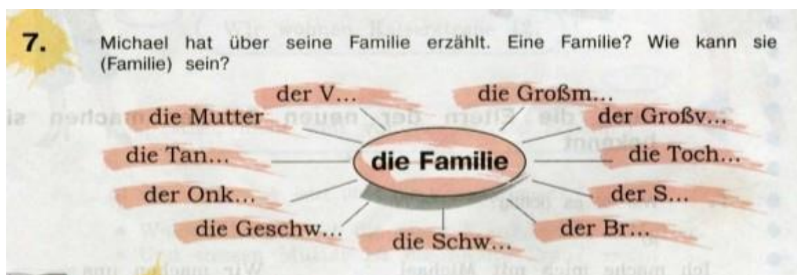
Рисунок 1 – Материалы УМК, с.7

Данное задание может являться дополнением к заданию УМК (Рисунок 1).