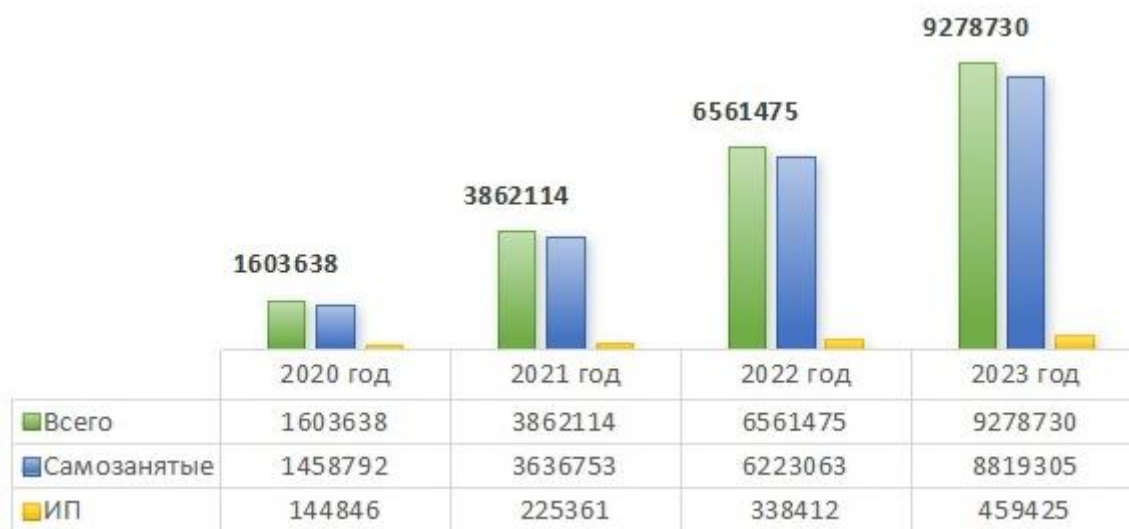
Рис. 2 Динамика роста числа пользователей приложения «Мой налог» [5]

В 2021 году был проведен опрос среди активных пользователей электронного сервиса «Мой налог», насколько по шкале от 0 до 10 они бы порекомендовали используемое приложение. В опросе поучаствовали около 100 тыс. человек и более 77% из них готовы рекомендовать приложение. Полученные выводы из опроса показывают заинтересованность и доверие к мобильному приложению ФНС России от самозанятых граждан.