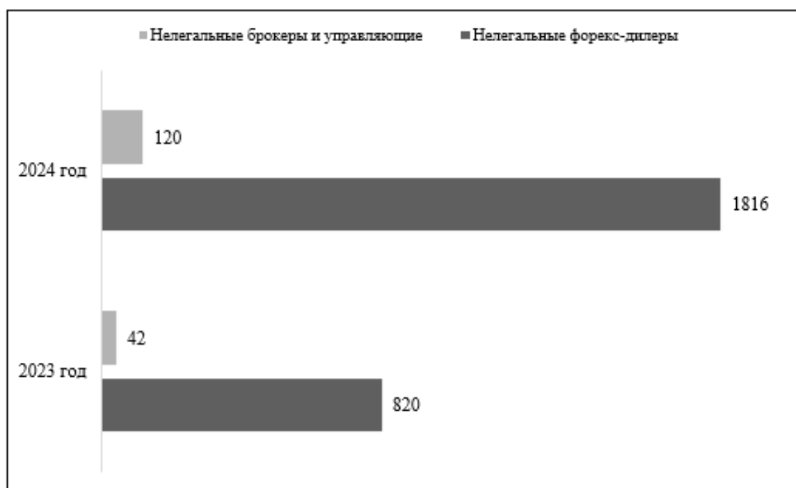
Рис. 2 – Динамика нелегальных участников рынка ценных бумаг

фиксирует, что если в 2023г. было отмечено всего 862 нелегальных профессиональных участников рынка ценных бумаг, то к 2024г. это число увеличилось до 1936 участников.