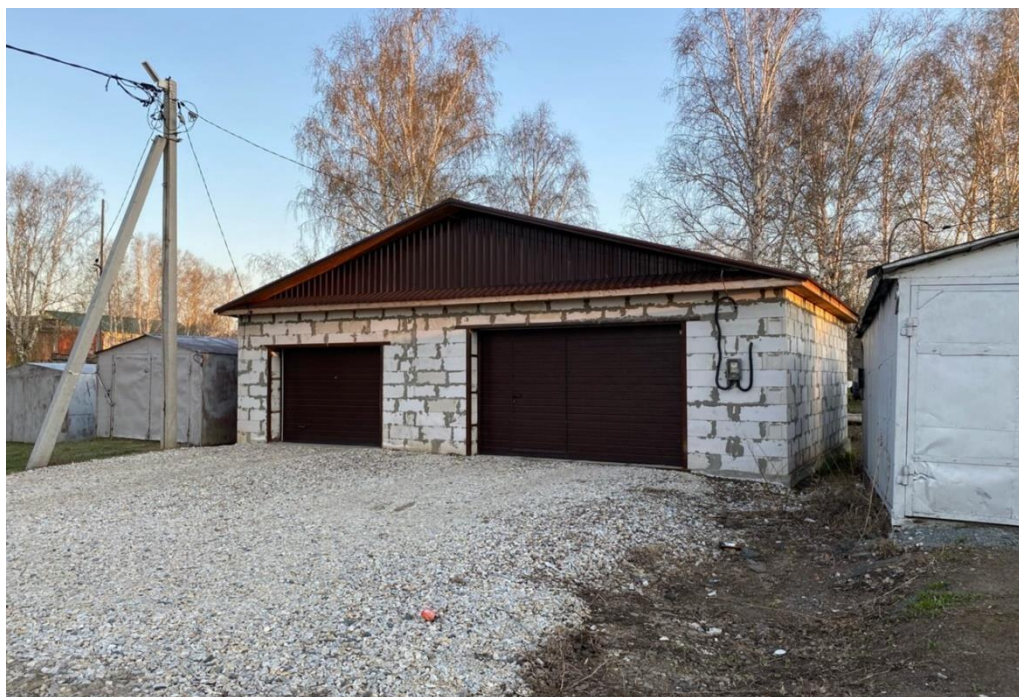
Рисунок 1 – Гараж гражданина Z

Результатом проверки является то, что земельный участок, расположенный по адресу: пгт. Тисуль, ул. Коммунистическая, за домом № 4 используется, не имея предусмотренных законодательством Российской Федерации (далее – РФ) оформленных прав на земельный участок.