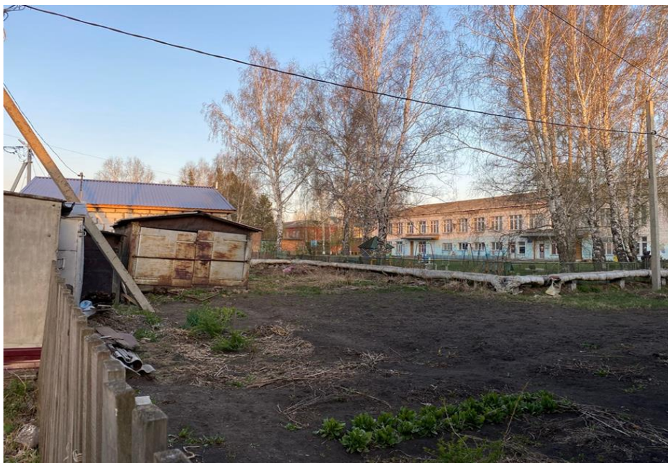
Рисунок 2 – Частные огороды

После проверки были разработаны рекомендации для граждан для устранения выявленных нарушений.