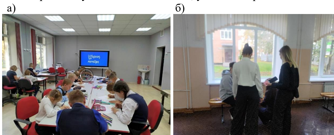
Рис. 2. Предпроектные исследования: а – графическое анкетирование, б – эмоциональная оценка пространства

Итогом аналитической работы стало составление и систематизация запросов от разных групп пользователей, которые легли в основы технического задания на разработку дизайн-проекта (рис. 3). По результатам исследования