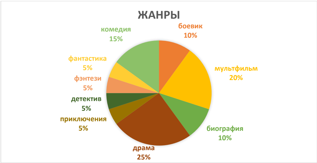
Рисунок 4 – Процентное соотношение жанров на 2023 год

В 2023 году драма становится популярным жанром. Однако, согласно отзывам, многие фильмы этого жанра не имеют четкого сюжета. Тем не менее, есть фильмы, которые способны глубоко затронуть душу зрителей и вызывать восхищение.