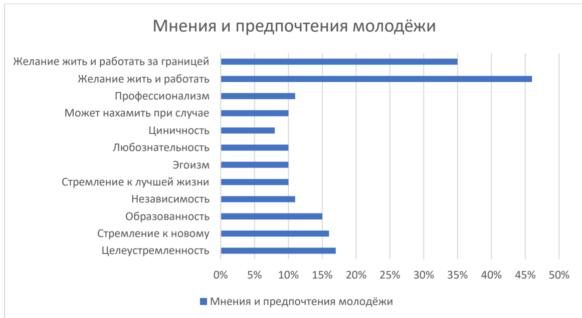
Рисунок 1 - Мнение молодёжи о себе и их предпочтения по мнению Microsoft Edge

Современное кино не боится показывать мир таким, какой он есть. Наученные фильмами, подростки, не имея большого жизненного опыта, более осведомлены о том, как вести себя в различных ситуациях. Посредством просмотра кино они расширяют свой кругозор, узнают новое о мире и людях, выстраивают собственное мнение по тому или иному вопросу. Современные фильмы учат ценить жизнь и проживать её в своё удовольствие, не бояться общественного осуждения, признавать личные достоинства и недостатки, уважать и любить самого себя