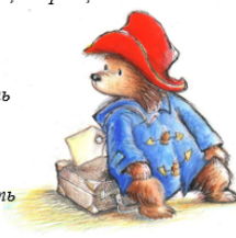
Рис. 2. Обучающий материал к просмотру фильма «Paddington 2»

После этого, был предложен просмотр второго фильма «Paddington 2»