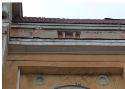
Рис. 9. Декоративные элементы на доме по ул. Притомская Набережная, 13

Ещё один дом, входящий в группу домов Притомского участка – дом по ул. Притомская набережная, 13 (рис.8). Отметим черты конструктивизма: масштабность и монолитность, присутствие карниза-поясочка. Однако здесь немало деталей в стиле неоклассицизма: это миниатюрные колонны, лепнина, обрамление окон и декоративные карнизы над ними, отделение первого этажа, трёхчастное деление фасадов (рис.9).