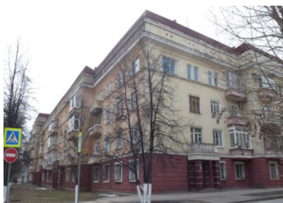
Рис. 8. Дом по ул. Притомская Набережная, 13

По проекту дом №1 представлял из себя внушительное строение, которое выделялось на фоне частных домов. Сегодня также видна масштабность задумки здания, в основе которой лежит конструктивизм: это можно заметить по сохранённому элементу часто встречающийся у этого стиля – карниз-поясочек у 4 этажа (см. рис. 7). Но как и в случае со строительством домов в Кировском районе – архитекторы искали новые решения, поэтому решили сдвинуть углы, получив дугообразную форму. Из других черт сталинского ампира можно отметить разделение дома на три части, визуальное отделение первого этажа с помощью обкладывания специальным камнем и облегчение верхних этажей более мелкими и частыми оконными проёмами, а также цветовое решение – сочетание бежевого и розового цвета (рис.7.). Всё это делает дом более элегантным и интересным.