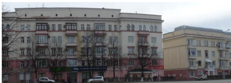
Рис. 6. Дом №1 по ул. Орджоникидзе, 3. Вид фасада

Дом №1 Притомского участка – сегодня его адрес – улица Орджоникидзе, 3 – был спроектирован в 1936 году молодым архитектором Петром Кушнарёвым (см. рис. 6).