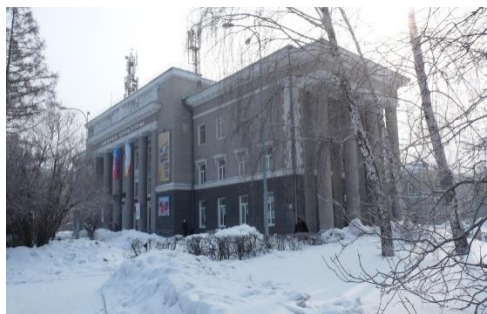
Рис. 1. Дворец Культуры им. 50-летия Октября

Наиболее яркой постройкой 30-х годов является здание Дворца культуры Кировского района [5], он был построен по проекту московского Гипротейатра (институт, проектировавший здания театров во времена СССР) и открыт в 1940 году (см. рис. 1; 2).