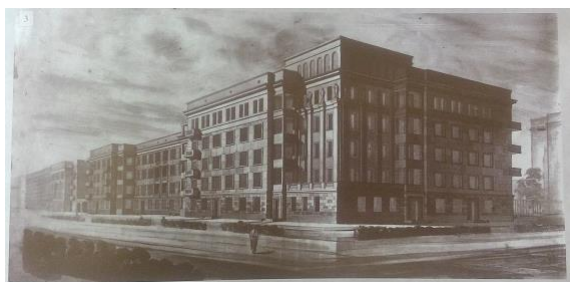
Рис. 3. Проект улицы Севастопольской

Также сочетание двух архитектурных стилей видно во следующих домах, построенных в Кировском в 30-е гг., это улицы Севастопольская и часть улицы Ушакова (см. рис. 3; 4).