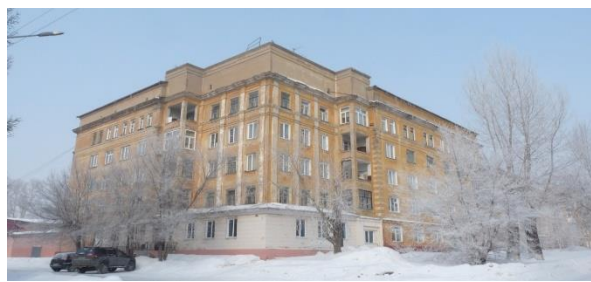
Рис. 4. Дом №1 по ул. Севастопольской