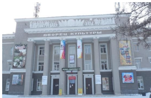
Рис. 2. Дворец культуры, фасад

Отметить присущее этому стилю вертикальное членение на 3 части – повышенная центральная и две боковых. Здание является образцом архитектуры переходного периода середины 1930-х годов, для которого характерны поиски новых средств архитектурной выразительности.