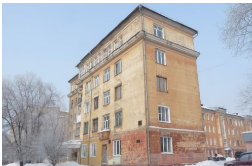
Рис. 5. Дом №2 по ул. Севастопольской