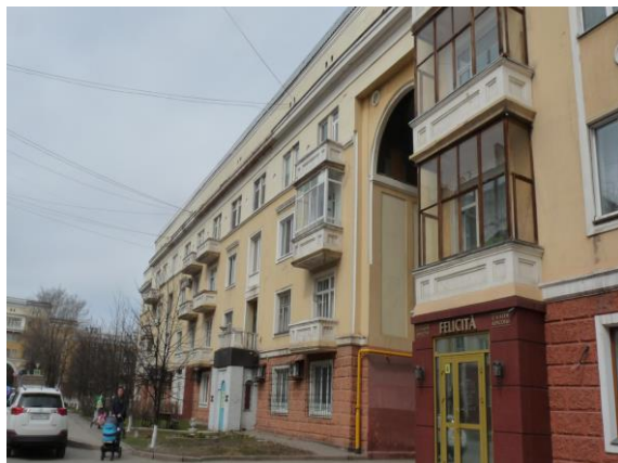
Рис. 10. Дом по ул.Орджоникидзе, 5

Третий дом Притомского участка – дом по ул. Орджоникидзе, 5 (рис.10). Здесь те же признаки, отмеченные нами выше – конструктивистская масштабность, геометрия здания, карниз-поясочек, и неоклассическое цветовое решение, отделение первого этажа, намёки на колонны.