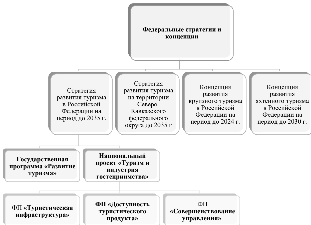
Рисунок 2 – Основные программные документы, регламентирующие развитие сферы туризма и рекреации на современном этапе на федеральном уровне

Государственная программа «Развитие туризма», принятая в 2021 году конкретизирует цели и задачи, изложенные в Стратегии, и правила предоставления субсидий региональным бюджетам, а также определила 12 ключевых туристских макротерриторий.