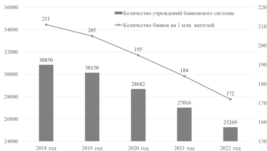
Рисунок 2 – Институциональная обеспеченность населения банками [5]

Институциональная обеспеченность населения России офисами кредитно-кассовыми офисами организаций банковской системы обеспечивается по итогам 2022 года из расчета 172 отделения на 1 миллион жителей (рисунок 2).