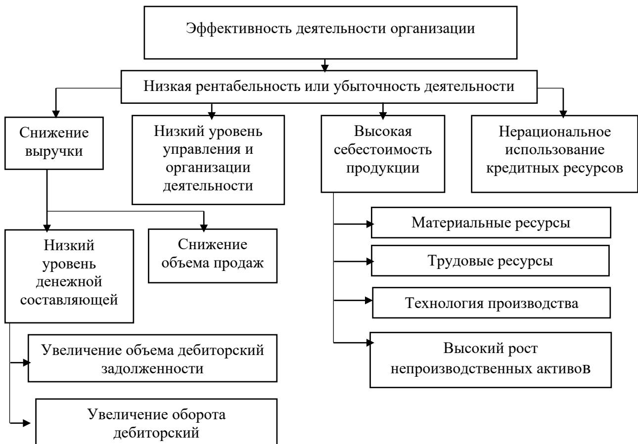
Рисунок 2 – Система причинно-следственных связей, влияющих на эффективность деятельности организации [4, с. 102]

Для выяснения причин кризисного положения хозяйствующего субъекта и выработки конкретных рекомендаций по его укреплению необходимо определить сущность проявления кризисных тенденций. Автор, О.А. Толпегина приводит систему причинно-следственных связей, которые влияют на эффективность деятельности организации (см. рис. 2).