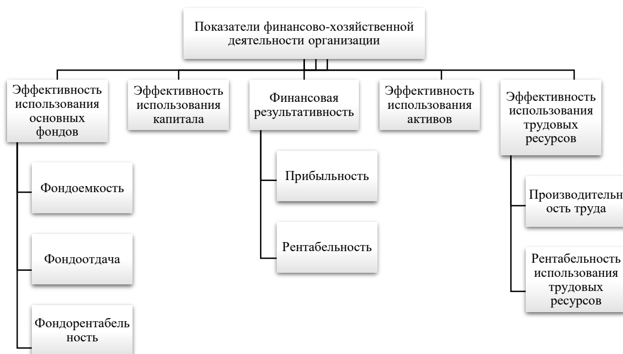
Рисунок 3 – Основные показатели эффективности финансово-хозяйственной деятельности предприятия [2, с. 172]

Для анализа финансово-хозяйственной деятельности используются показатели, характеризующие различные направления и элементы внутренней среды организации. Основные из них перечислены на рисунке 3.