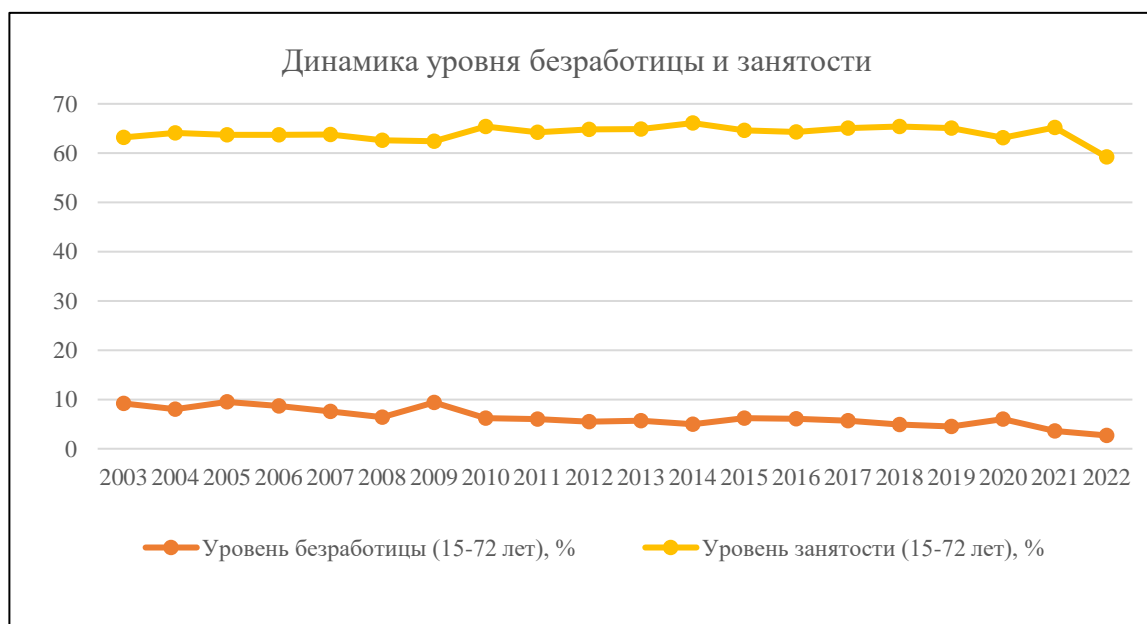
Рисунок 2 – Динамика уровня безработицы и занятости в Красноярском крае за 2003-2022 гг., % [9]

Численность рабочей силы и численность занятых являются важными показателями в области экономики и рынка труда, взаимосвязанными между собой. Если численность занятых снижается, это может свидетельствовать об уменьшении уровня занятости в экономике, что в свою очередь может отразиться на общей производительности и благосостоянии. Управление этими показателями имеет важное значение для понимания состояния рынка труда и разработки стратегий для поддержания и увеличения уровня занятости в регионе.