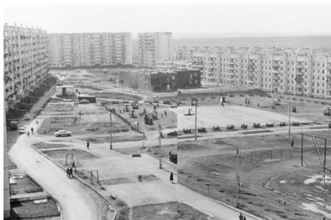
Рис. 1. Микрорайон Красный камень 1980 г.