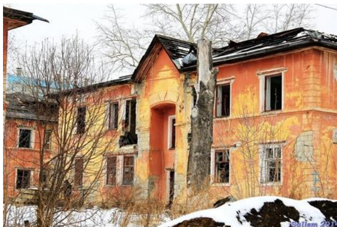
Рис.2. Брошенное жилье

В некоторых районах можно встретить полностью брошенное жилье (рис. 2).