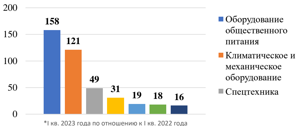
Рисунок 3 - Прирост нового бизнеса по видам предметов лизинга (в %)

связано с тем, что предприятия и предприниматели ищут альтернативные способы финансирования при сложившейся ситуации.