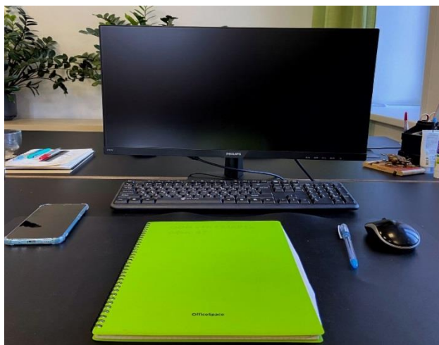
Рисунок 3 – Рабочее место логиста

На каждого сотрудника приходится 1 компьютер, который состоит из монитора, системного блока, мыши и клавиатуры (рис.3). Простое рабочее место – один работник обслуживает один компьютер. Все необходимые для работы полки, тумбы, шкафы находятся на расстоянии вытянутой руки. Такое расположение мебели позволяет исключить ненужные затраты энергии и направить все силы на выполнение непосредственных обязанностей.