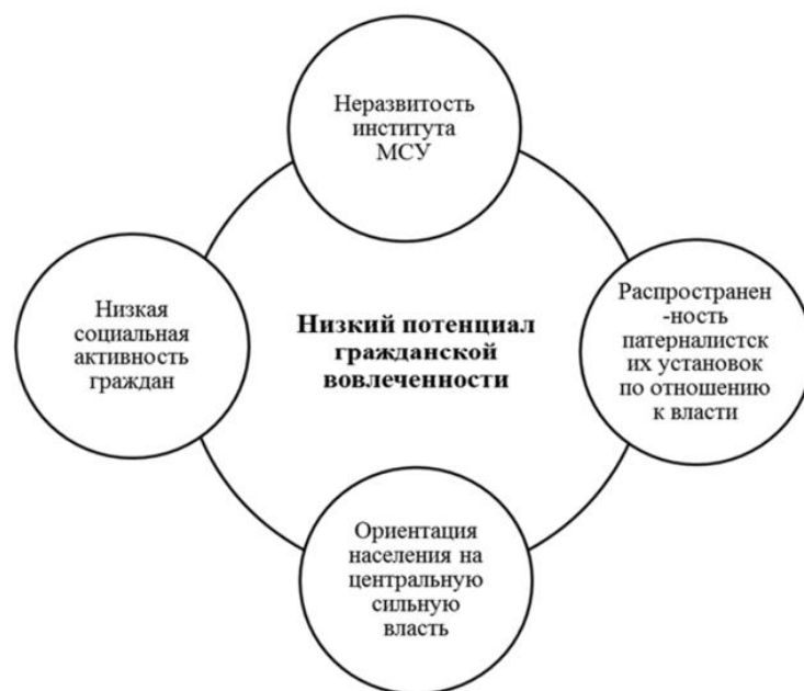
Рис. 1 – Факторы, характеризующие пассивность местного населения

На сегодняшний день проблему заинтересованности граждан в реализации местного самоуправления исследуется многими учеными. Согласно их единому мнению, местное самоуправление в России находится на колоссально низком уровне развития. Низкая развитость института местного самоуправления является первым фактором, характеризующим безучастие местного населения (рис. 1) [4].