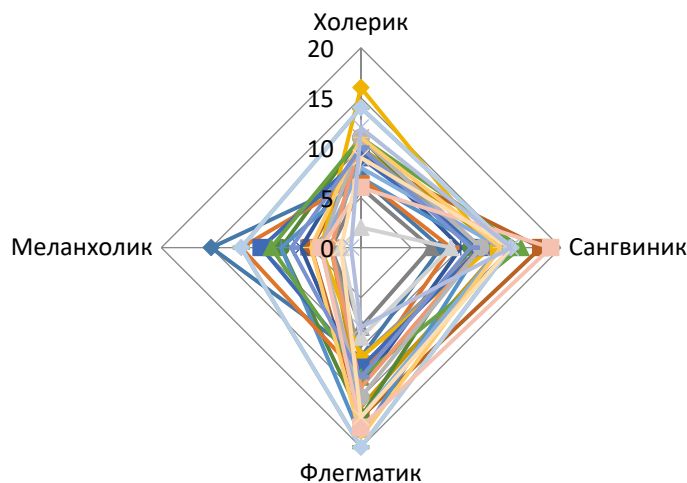
Рисунок 2 – Часто встречаемые типы темперамента среди респондентов

Данные исследования по темпераменту представлены в виде графика (рисунок 2).