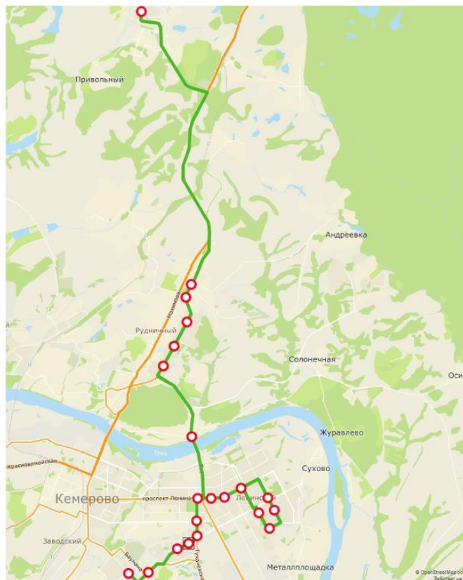
Рисунок 2 – Схема служебного маршрута «ж.р.Кедровка – г.Кемерово»

- анализ затрудненности сообщения на существующих маршрутах; - разработка мероприятий, направленных на совершенствование организации служебных перевозок. К таким мероприятиям можно отнести приобретение подвижного состава адекватной пассажироместимости и высокой комфортабельности, обустройство дополнительных остановочных пунктов на маршруте, изменение графика движения служебных транспортных средств, использование технологии GPS для отслеживания местоположения транспортного средства и т.д.;