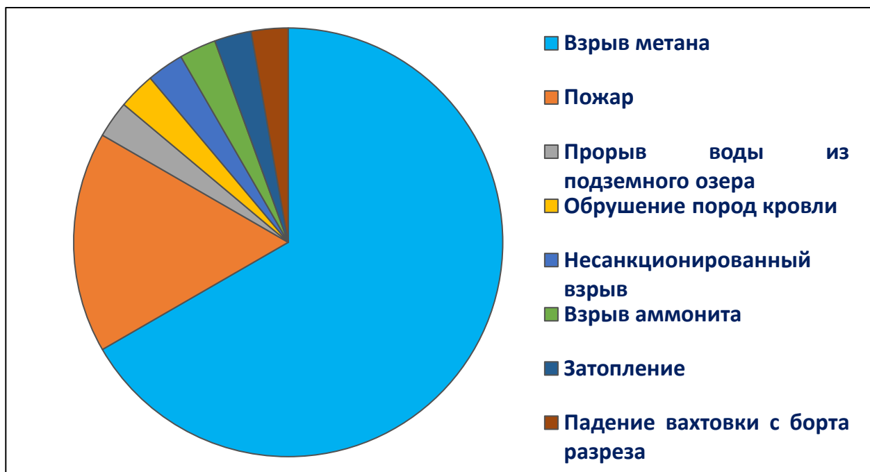
Рис. 3 Вид аварии на шахтах России 1992 – 2021 гг.

Исходя из данной проблемы выдвигаю социально значимое инновационное предложение внести изменение в статью 20 [2]: об ответственности должностных лиц за сокрытие нарушений приведших к гибели граждан в отраслях народного хозяйства, создающих угрозу для жизни и здоровья людей.