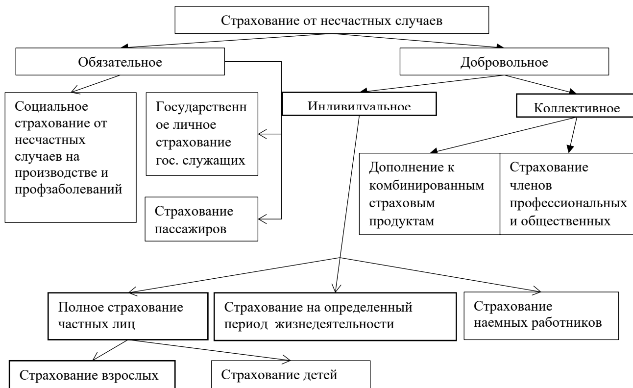
Рис.1. Страхование от несчастных случаев

заключается по желанию страхователя (юридического или физического лица), а не в силу закона.