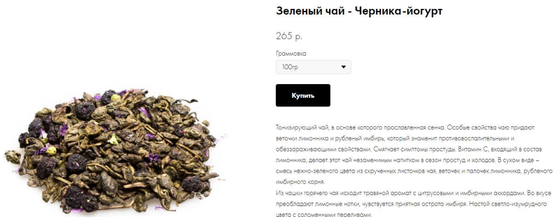
Рисунок 3 - Карточка товара