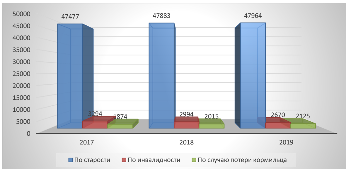
Рис. 2. Динамика изменения численности страховой пенсии в 2017-2019 гг., чел.

Аналогично проанализируем динамику изменения численности пенсионеров, получающих пенсии по государственному пенсионному обеспечению. Представим ее на рисунке 3.