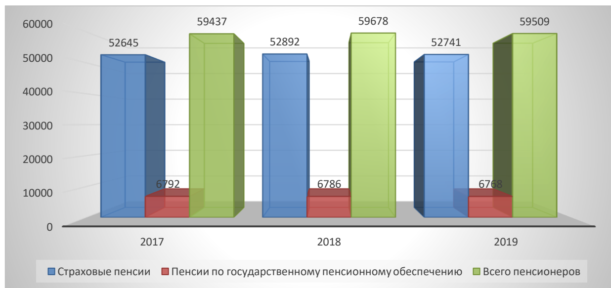
Рис. 1. Динамика численности пенсионеров в 2017-2019 гг., чел.

Для организации эффективной работы Управления необходимо проводить анализ численности пенсионеров по различным их категориям. Динамику численности по различным категориям пенсионеров представим на рисунке 1.