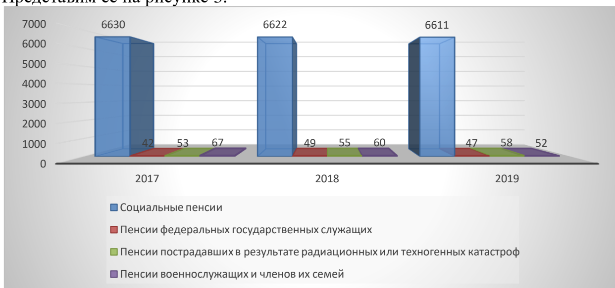
Рис. 3. Динамика изменения численности пенсии по государственному пенсионному обеспечению в 2017-2019 гг., чел.

Аналогично проанализируем динамику изменения численности пенсионеров, получающих пенсии по государственному пенсионному обеспечению. Представим ее на рисунке 3.