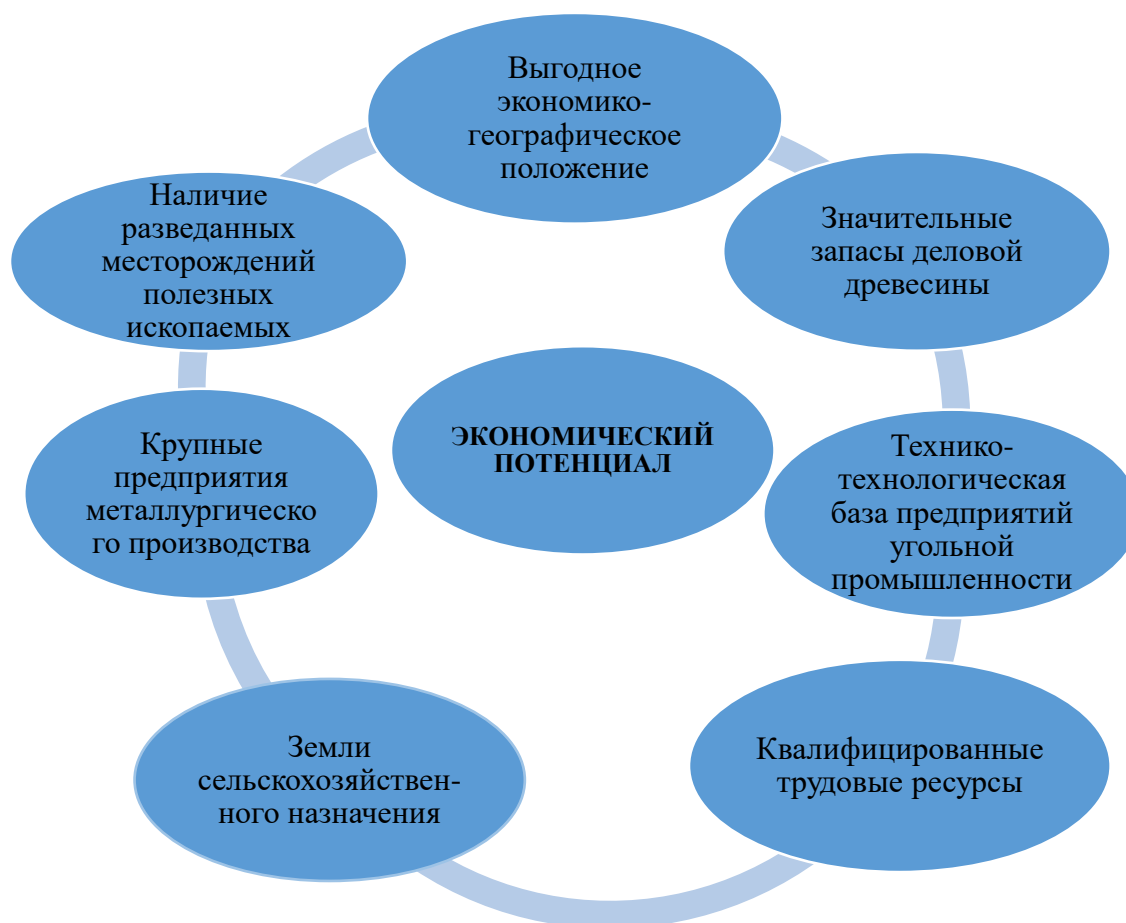
Рис. 1. Экономический потенциал Гурьевского муниципального округа

Необходимо отметить, что наибольшую часть земельного фонда Гурьевского муниципального округа занимают земли лесного фонда - 55,8%, поэтому наличие значительных запасов деловой древесины является одним из важных аспектов экономического потенциала и может способствовать развитию деревообрабатывающей промышленности, созданию новых рабочих мест, увеличивая тем самым доходные статьи бюджета.