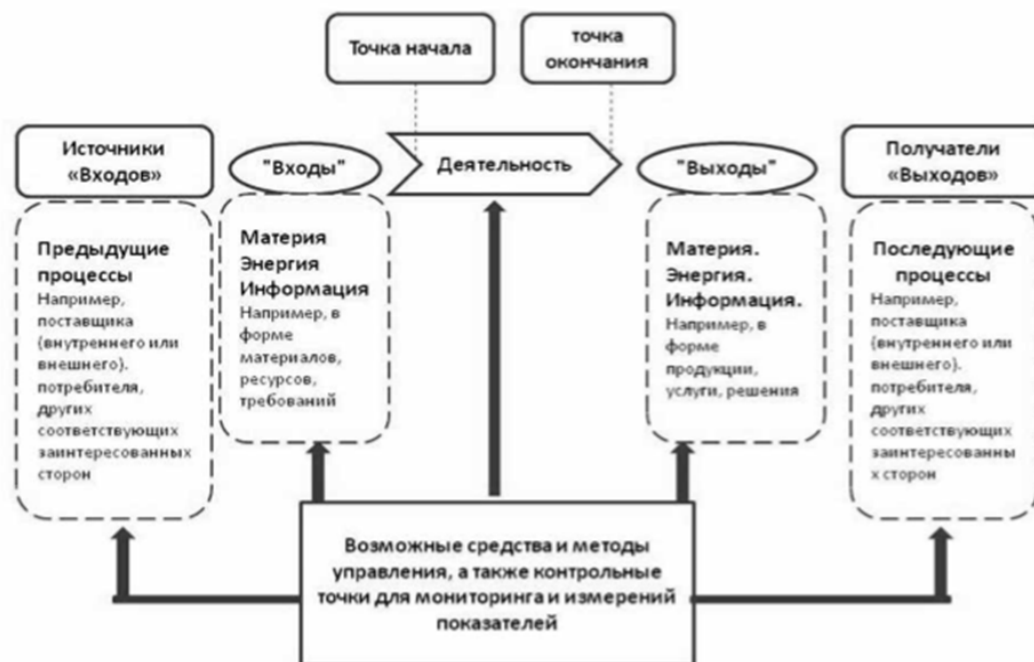
Рис.1. Схематическое изображение элементов процесса

При этом к элементам «входов» СКК образования также можно отнести требования нормативно правовых актов, которые регулируют вопросы в данной сфере.