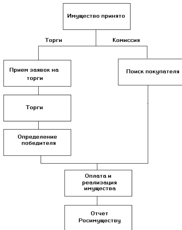
Рисунок 1 - Схема реализации арестованного имущества

Схема реализации арестованного имущества представлена на рисунке 1.