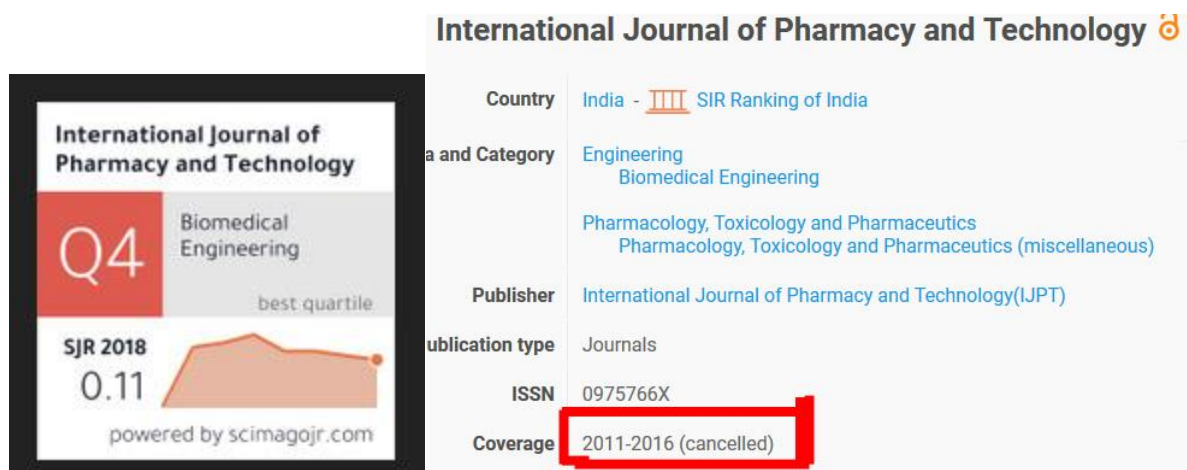
Рис. 3. Картинка слева – с сайта журнала; картинка справа – с сайта scimagojr.com (актуальная информация о вхождении научного издания в БД Scopus)