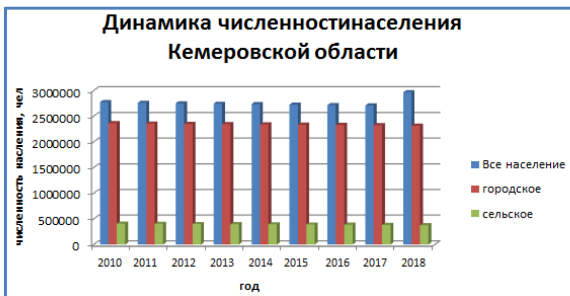
Рисунок 1. Динамика численности населения Кемеровской области за 2010-2018 гг.

вила – 39,2%, лица от 30 до 50 лет – 40,1%, от 50 до 60 лет – 16,2% и старше 60 лет – 4,5%. Среди безработных женщины составляют 39,6 тыс. человек, или 48,9%, уровень безработицы у мужчин и женщин сложился одинаковый – 6,1%. Из общей численности безработных 67,7 тыс. человек (83,6%) проживают в городской местности, уровень безработицы среди сельских жителей (7,7%) превышает уровень безработицы у городских жителей (5,9%). Из общего числа безработных 14 тыс. человек (17,3%) не имели опыта работы и искали её в 2018 г. впервые. Основными способами поиска работы остаются обращение к друзьям, родственникам, знакомым и обращение в СМИ, Интернет. Доля безработных, воспользовавшихся этими способами, составила 64,7% и 57,1% соответственно. В государственную службу занятости обращались 31,8% безработных (в 2017 г. – 36,8%). Среднее время поиска работы составило 8 месяцев против 8,5 месяца в 2017 г. [3].