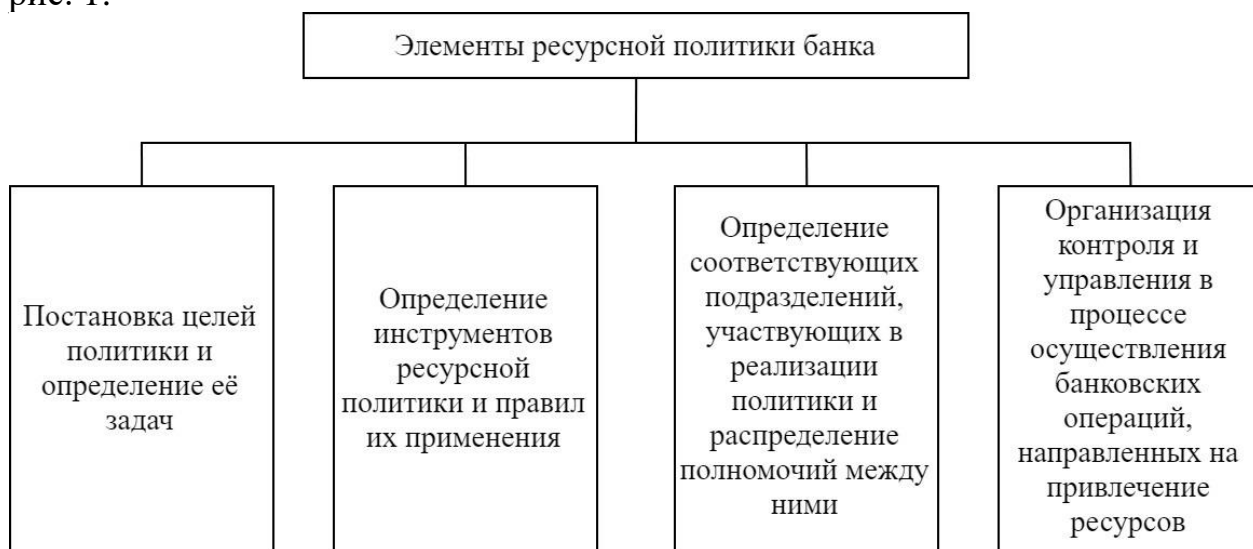
Рис. 1. Элементы ресурсной политики банка

Элементы, составляющие ресурсную политику банка, рассмотрены на рис. 1: