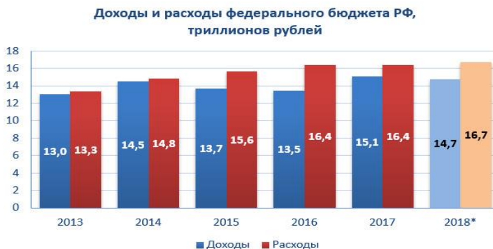
Рисунок 1 – Доходы и расходы федерального бюджета за 2013-2018 гг.

Следует разделять государственный бюджет на следующие группы: доходы и расходы. Соотношение доходной и расходной частей приведены на рисунке 1.