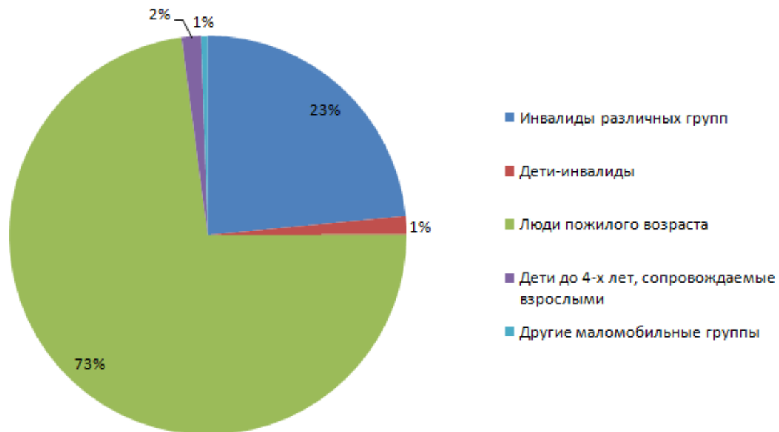
Рисунок 2– Распределение маломобильных групп

Исследование состава маломобильных групп граждан по категориям выявило, что большую часть составляют дети, возрастом до 15 лет и пожилые люди (рисунок 2).