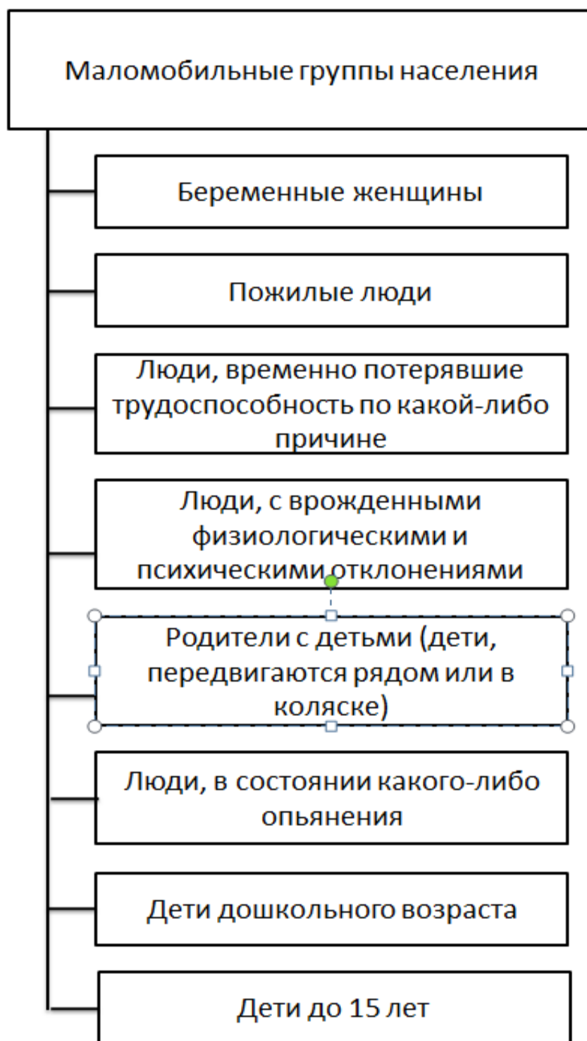
Рисунок 1 – Классификация маломобильных групп населения

К МГГ относится достаточно широкая категория граждан. Как правило, заболевания опорно-двигательной системы делают человека маломобильным, но имеется еще ряд заболеваний и причин, влияющих на его мобильность, например: болезненная тучность, слабое зрение, преклонный возраст и т.д.