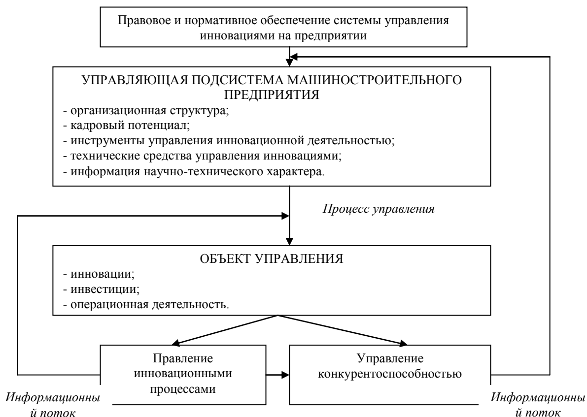
Рисунок 1. Механизм нормативно-правового обеспечения системы инновационного менеджмента машиностроительного комплекса

Что касается перспектив развития рынков машиностроения и факторов, которые оказывают влияние на конкурентоспособность российских предприятий машиностроительного комплекса (Рисунок 2), то в качестве главной цели развития отраслевых предприятий является производство качественной конкурентоспособной продукции для внутреннего и внешнего рынка. Для реализации поставленной цели необходимо внедрение инноваций и инновационной политики в рамках функционирования предприятия на всех производственных циклах.