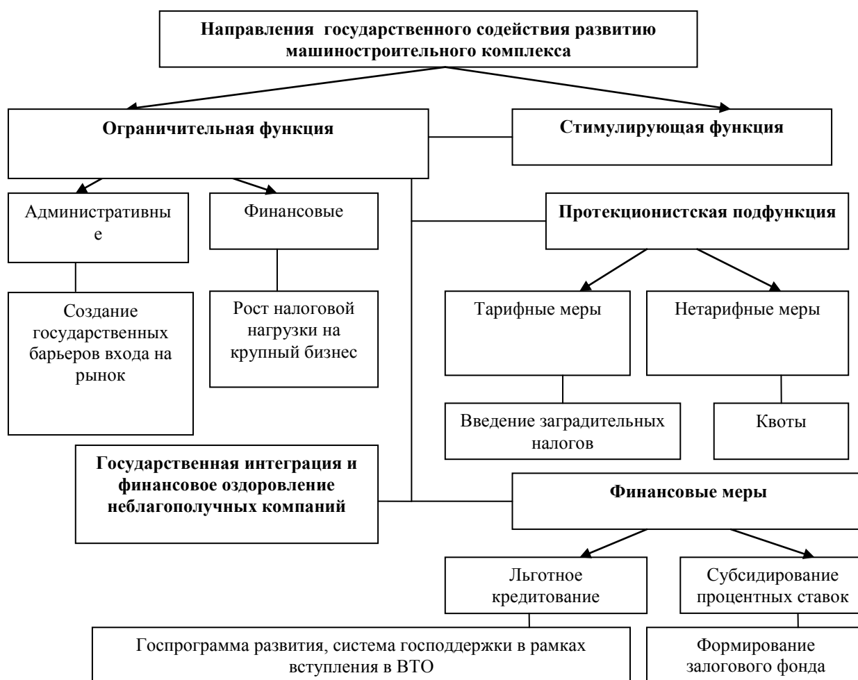
Рис. 2. Направления государственного содействия обеспечению устойчивого развития предприятий машиностроительного комплекса

На основании предложенной системы целеполагания мы предлагаем следующие меры государственного содействия обеспечению устойчивого развития машиностроительного комплекса (рисунок 2).