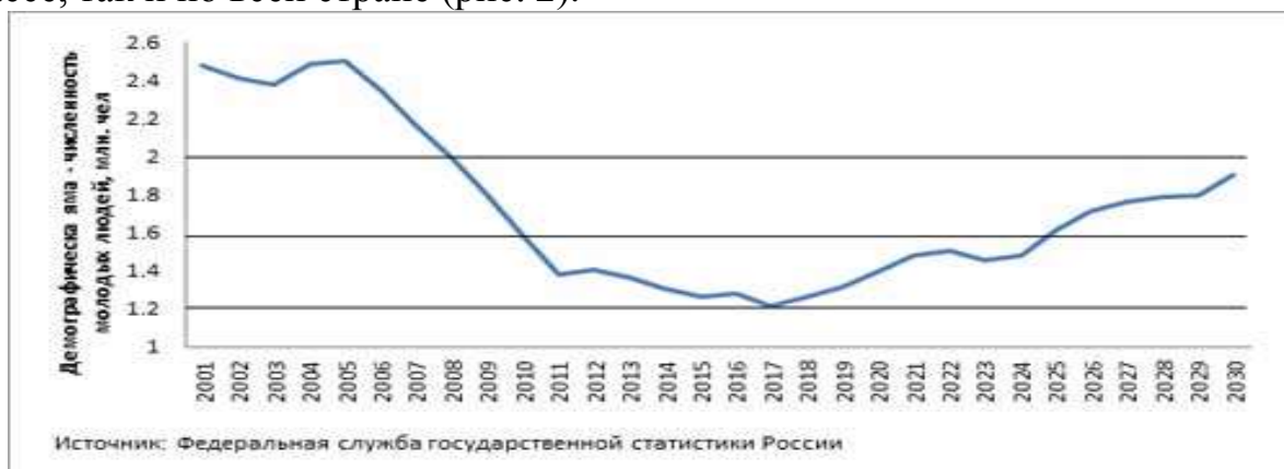
Рис. 2. Динамика численности молодых людей в РФ с прогнозом до 2030 г. [5].

Случилось не только сокращение выпуска специалистов, но и уменьшилось число организаций высшего профессионального образования. Такое сокращение организаций высшего профессионального образования произошло вследствие проведения мониторинга эффективности деятельности образовательных организаций. В мониторинге 2014 г. участвовало 9 вузов и 27 филиалов, из которых 7 вузов и 18 филиалов успешно прошли мониторинг, а 2 организации высшего профессионального образования и 9 филиалов находятся в стадии реорганизации/ нуждаются в реорганизации. В 2015 г. приняли участие в мониторинге 7 вузов и 27 филиалов, все 7 вузов показали хорошие результаты, но из филиалов прошли только 10 [4]. Основная причина уменьшения числа вузов и филиалов - не соответствие предъявляемым требованиям, неспособность конкурировать с другими вузами и филиалами, необходимость в реорганизации деятельности. Но, несмотря на закрытие вузов и филиалов, переставших соответствовать требуемому уровню качества высшего образования, количество выпускников школ региона, поступающих в оставшиеся вузы не увеличивается из-за «демографической ямы» как в Кузбассе, так и по всей стране (рис. 2).