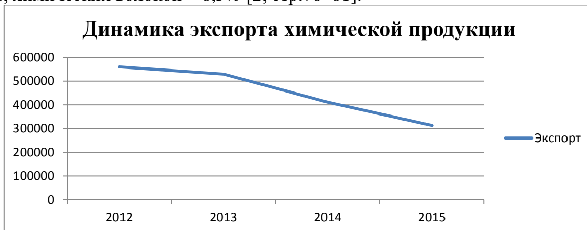
Рис. 1 Экспорт химической продукции в период 2012-2015 гг.

С начала 2000–х гг. поддержка развития химической отрасли Кузбасса стала важной задачей региональных властей, связанной с обеспечением экономической безопасности региона и страны. Сейчас в химической отрасли области функционируют 15 крупных и средних промышленных предприятий, производящих около 300 видов продукции. Доля кузбасской химии в общем объеме химического производства РФ довольно высока. Так, доля синтетического аммиака составляет 9%, синтетических смол и пластмассы – 7%, химических волокон – 8,5% [2, стр.78–81].