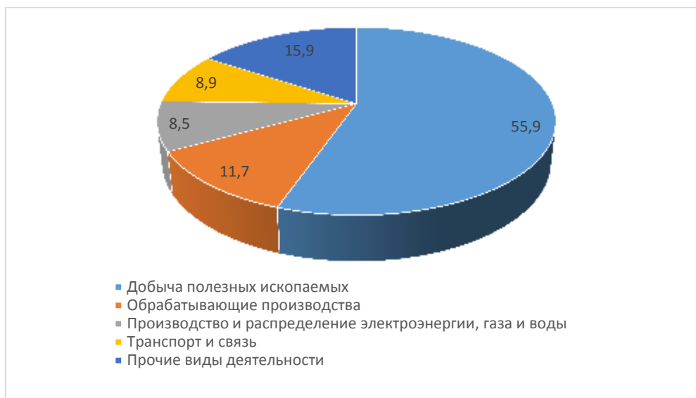
Рис. 1. Структура инвестиций в основной капитал по видам экономической деятельности в 2014 г., % [6]

По итогам 2014 г. наибольший удельный вес инвестиций пришелся на добычу полезных ископаемых – 55,9%. Нужно отметить, что на протяжении последних трех лет данный показатель не меняется и находится на уровне 48 – 56%.