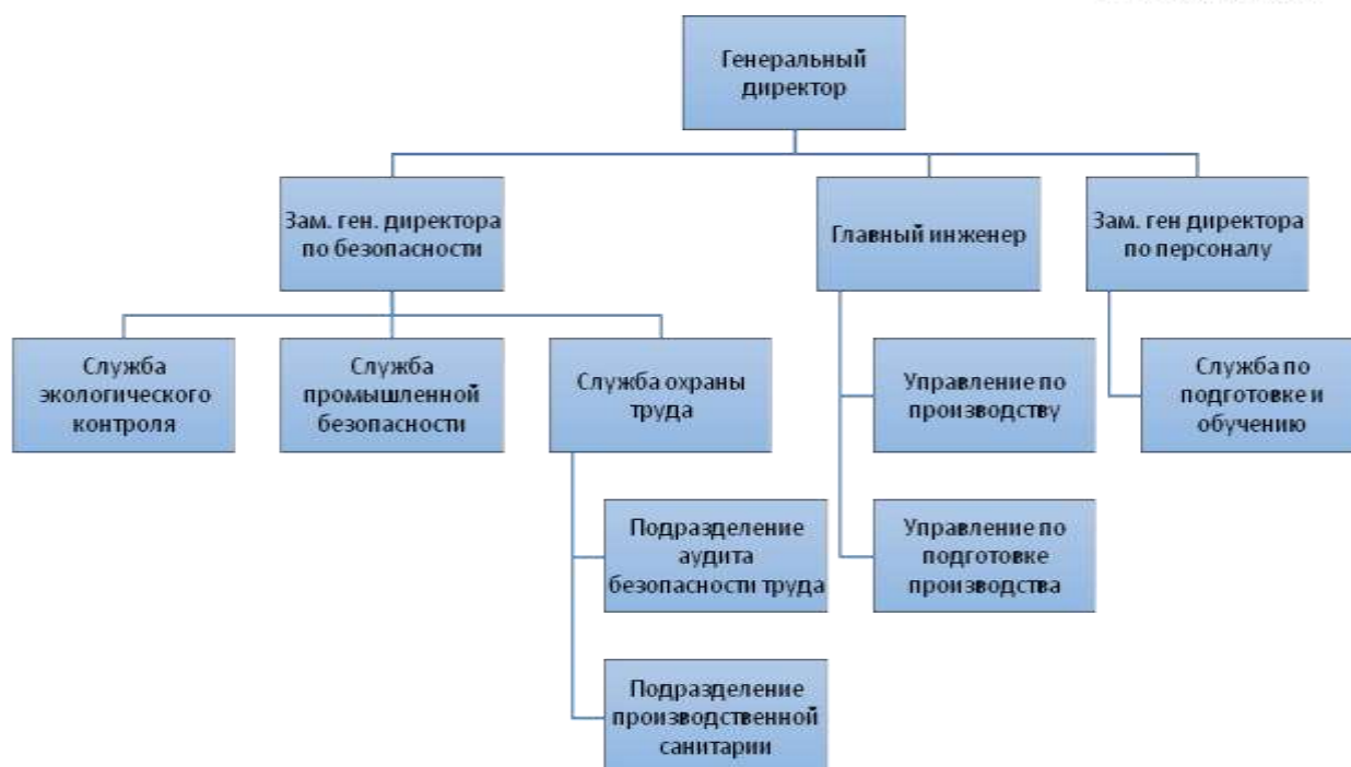
Рисунок 2. Структура угольного предприятия

Ключевой службой, осуществляющей организацию СУОТ на предприятии в угольной промышленности является служба охраны труда, которую по сферам деятельности необходимо разделить на подразделение организующее аудит безопасности труда в подразделениях и так же на подразделение, занимающееся производственной санитарией, которое в свою очередь, проводит оценку состояния охраны труда со стороны специальной оценки условий труда (далее по тексту – СОУТ).