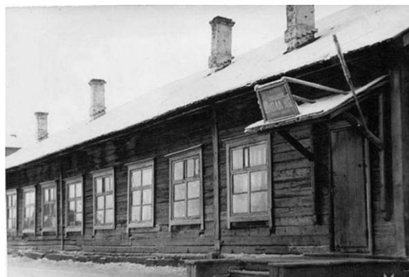
Рис. 2. Станция Анжерская и школа №1 на ул.Перовской

Станции и копиям требовался обслуживающий персонал. В связи с этим началось строительство барачных для служащих и шахтеров. В 1898 г. на территории станции были построены две казармы и две будки, в которых жили железнодорожные рабочие. В 1906 г. на копиях Михельсона было 35 барачных. Определенной планировки у барачных не было. В барачном размещалось 10-12 семей. Посреди барачного располагалась общая плита, по сторонам стояли двойные нары. Там же лежали запасы пищи, постель, одежда и обувь. В большинстве домов освещения и электричества не было. На весь район была одна общая баня, работающая только по субботам. Планов этих построек не сохранилось.