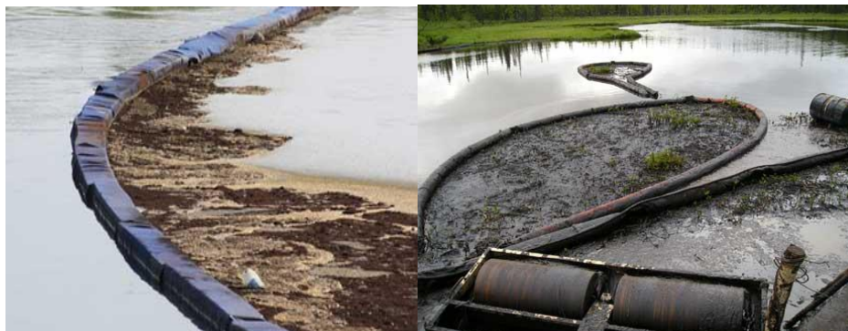
Рис. 2. Использование бонового оборудования

ванным способом. После сбора эта масса подлежит утилизации. Насыщенный сорбент можно не извлекать немедленно с поверхности воды, а отложить это до удобного времени (например, до улучшения погодных условий), благодаря его способности прочно удерживать адсорбированные углеводороды.