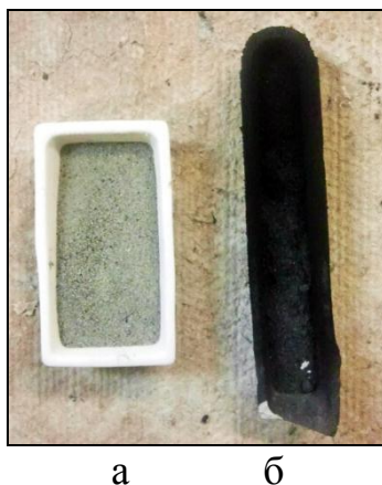
Рис. 1. Внешний вид образцов навески микросферы до (а) и после (б) нанесения пиролитического углерода

Сравнение образцов исходных микросфер и после процесса нанесения пироуглерода представлены на рис. 1, 2. Видно, что модификация поверхности произошла. Для полученного материала характерен металлический блеск.