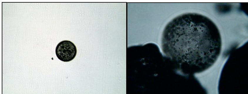
Рис. 3. Внешний вид образцов твердой матрицы после (а) и до (б) нанесения пиролитического углерода

линз с увеличением в 100 и 400 раз. На рис. 3 показан характерный снимок образа модифицированной микросферы. Видно, что произошло уплотнение поверхностных пор пироуглеродом.