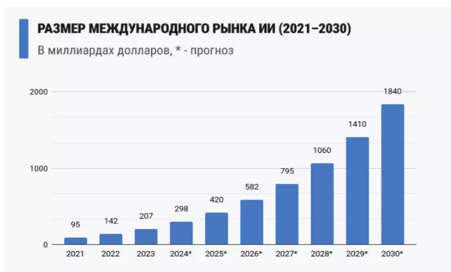
Рисунок 1. Совокупный размер международного рынка искусственного интеллекта в текущих условиях на период, 2021-2030 гг. [3].

Современные технологии постоянно находятся в процессе улучшения, благодаря чему создаются новые способы решения различных задач. Искусственный интеллект тому подтверждение. Многие процессы переходят из категории ручного расчёта в категорию автоматизированных. Если раньше нужно было изучить определенную тему, узнать формулу для определённого расчёта, подробно вникнуть в неё, обдумать её, то сейчас будет вполне достаточно найти нужную информацию в интернете, вставить формулу и сохранить её в шаблоне — например, в том же Excel. В итоге мы получим готовый файл с автоматическими расчётами.