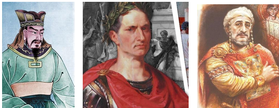
Рисунок 1. Военачальники: Сунь Цзы, Гай Юлий Цезарь, византийский император Маврикий

Мир быстро меняется — следовательно, технологический прогресс, географические и климатические изменения создают беспрецедентную сложность и неопределенность, заставляя организации принимать следующую модель планирования: не просто прогнозирование, а новую стратегическую идею будущего. Как и все науки, теория стратегии берет свои истоки в философии. Однако изначально стратегия была разработана именно благодаря военачальникам: Сунь Цзы, Гаю Юлию Цезарю, византийскому императору Маврикию.