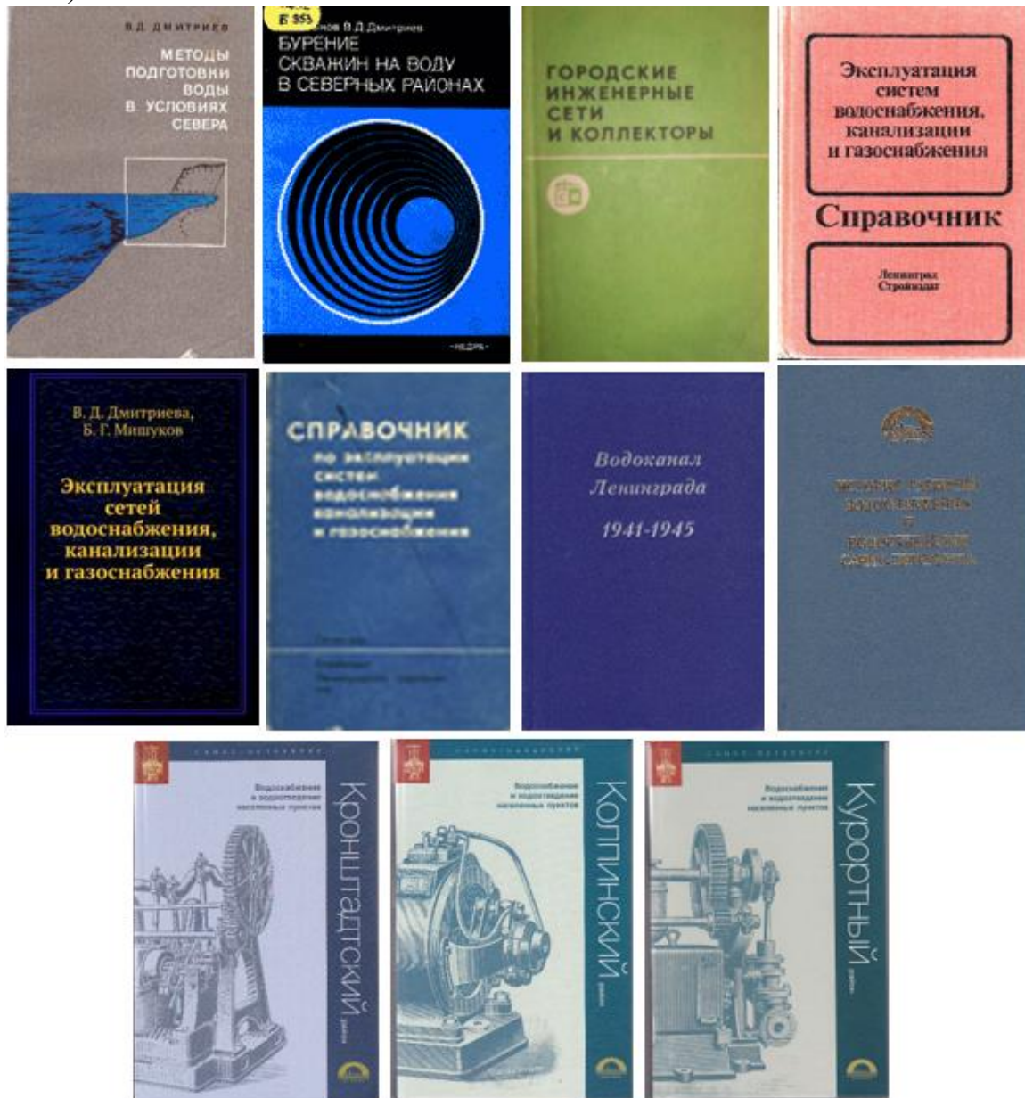
Рис. 4. Творческое наследие Дмитриева В.Д. (неполный перечень трудов)

лѐнных пунктов Кронштадского района» (2007); «Водоснабжение и водоотведение населѐнных пунктов Курортного района» (2008); «Водоснабжение и водоотведение населѐнных пунктов Колпинского района» (2009) (рис. 4).