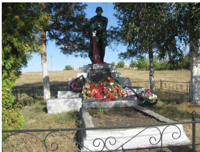
Рисунок 2 – братская могила, село Богатырева