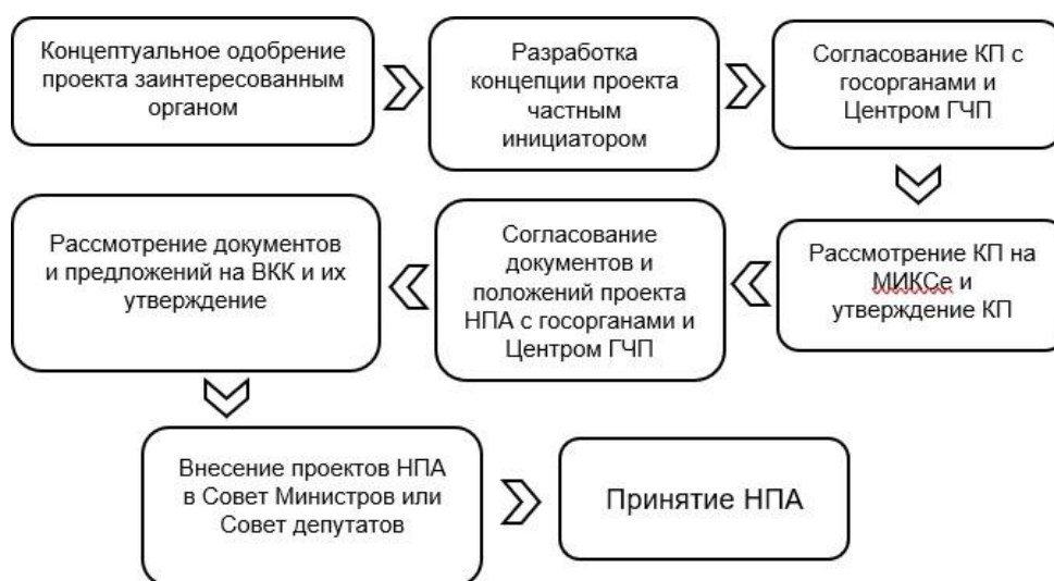
Рисунок 2 – Схема заключения соглашения ГПЧ при инициативе частного партнера

Таким образом, государственно-частное партнерство – это основанное на объединении инвестиций сотрудничества государства, в виде его административно-территориальной единицы, как партнера с одной стороны, и частного партнера, определяемого посредством проведения конкурса, с другой стороны, предусматривающее распределение прибыли, убытков, рисков, ответственности между сторонами, реализуемое в определенных фор-